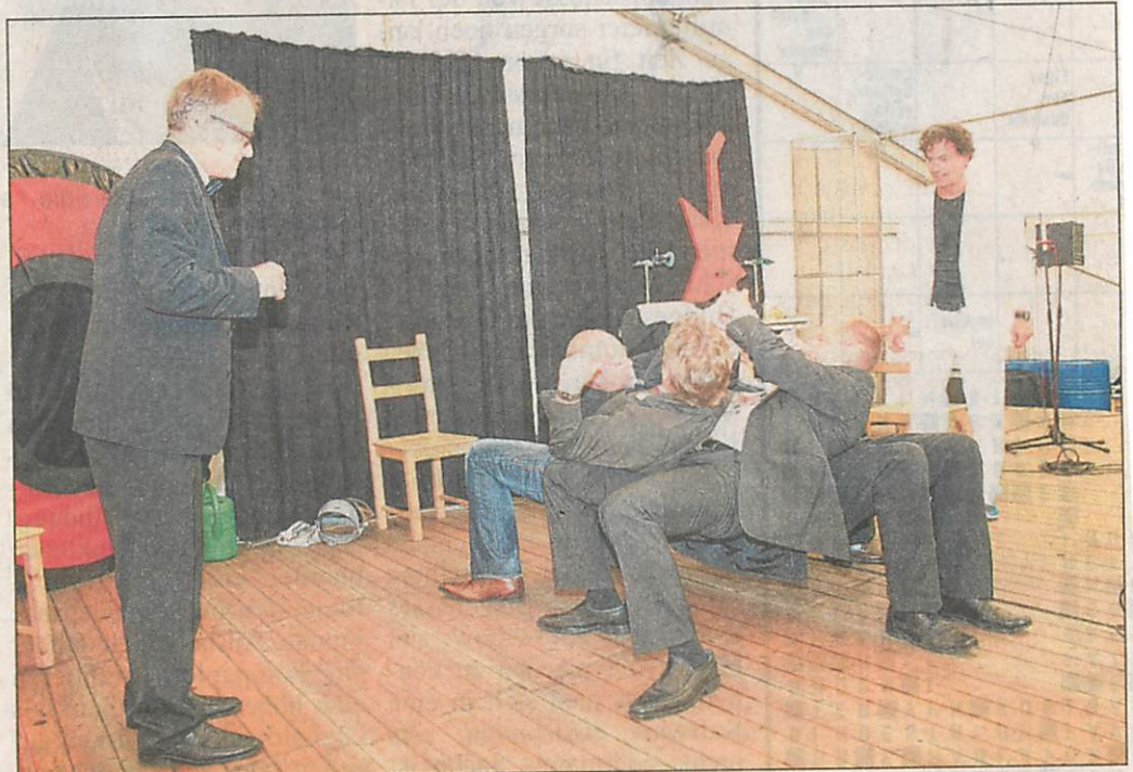
Zur Teilnahme an den Experimenten wurden auch einige Gäste verdonnert. Auch diese waghalsige gymnastische Übung haben alle Teilnehmer gut überstanden.